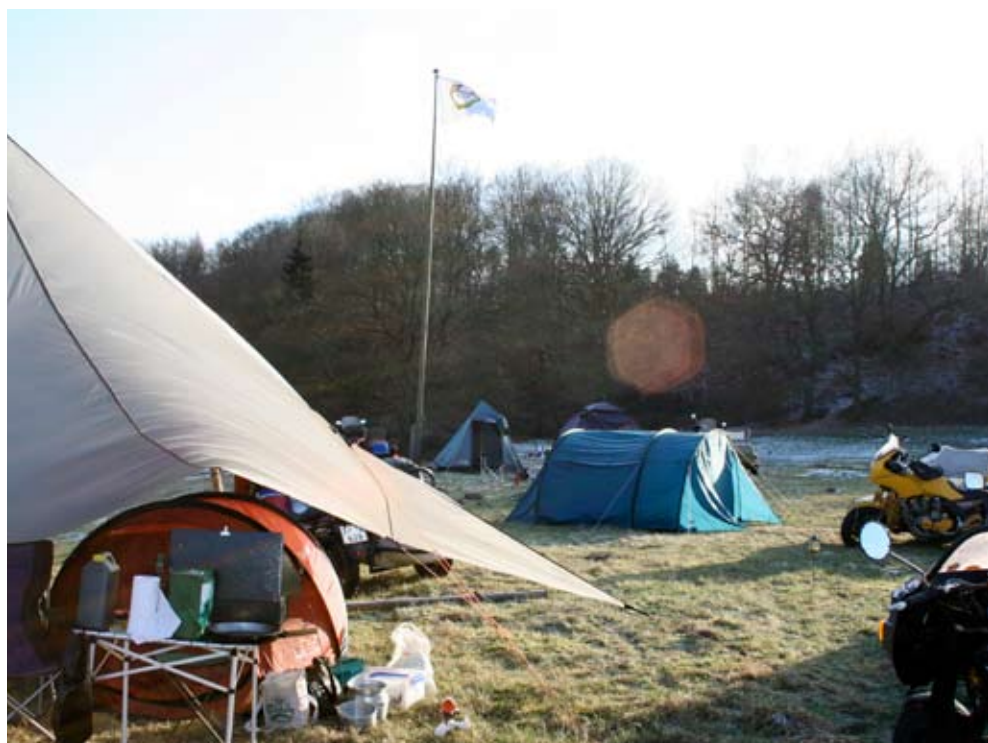
12. Gudenå træf

MC Højbjerg · Jegstrupvej 67 · 8361 Hasselager · Tlf. 8629 5139 · mail@mchojbjerg.dk