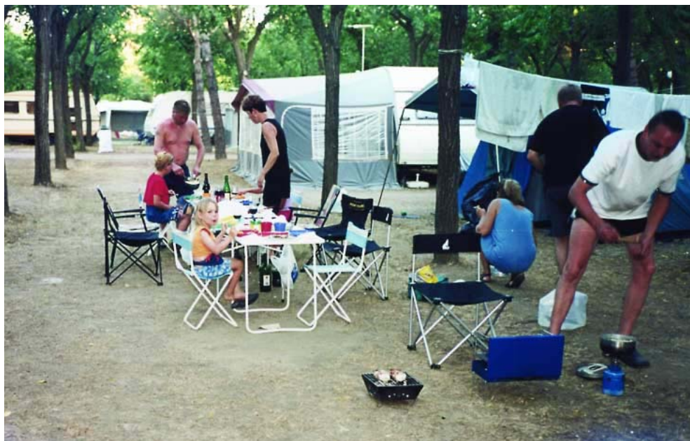
Som så mange aftener var der stor Grill fest på campingpladsen.

der vi helt fremme i køen ? Det med at komme på toget gik uden problemer, og finde vores kupe, men hvad var nu det ? vi kørte jo ikke. En eller anden havde talt forkert så der manglede plads til 3 biler, og vi fik den første forsinkelse, - det blev ikke den sidste.