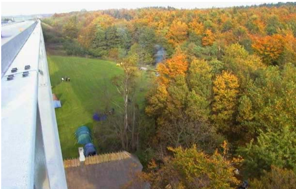
Bakkebøllestrand og find selv vej.