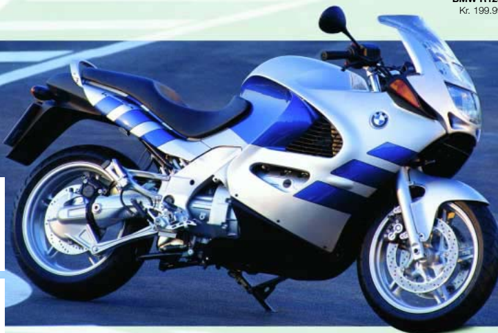
BMW K1200RS Kr. 214.985