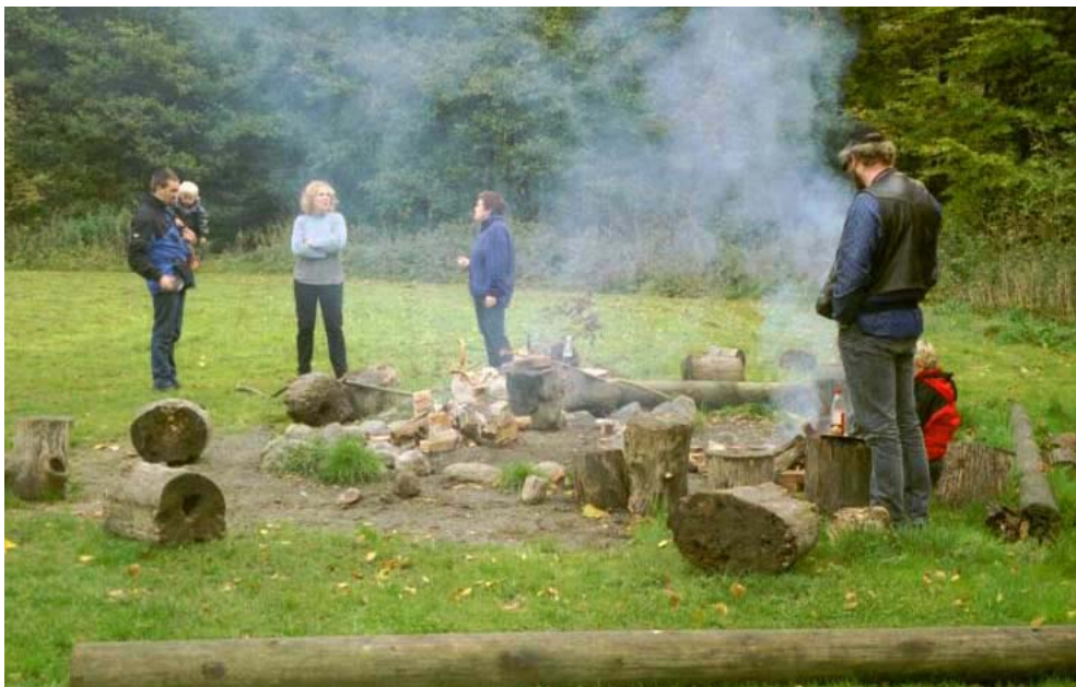
Efter en obligatorisk ankomst øl, var det tid til teltslagning.