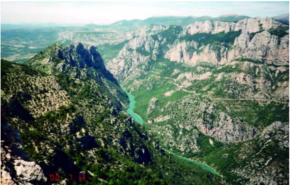
Udsigt over dalen.