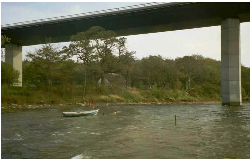
Stranden med små blide bølgeskulp kun ligger 20 meter væk