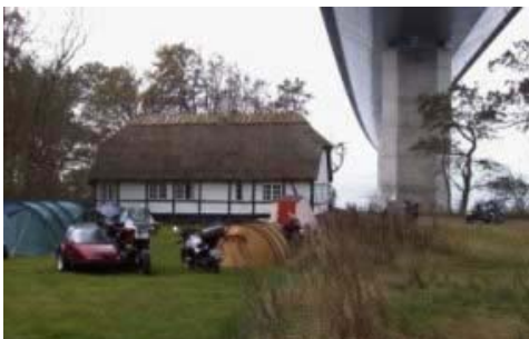
Under broen skal tages meget bogstaveligt.