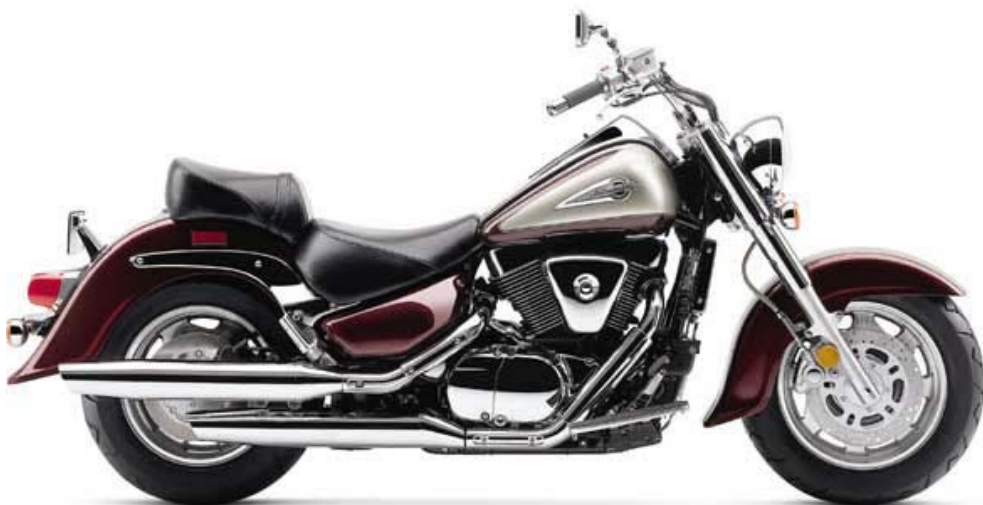
Intruder LC VL 1500

Randersvej 36 - 8200 Århus N - 86 16 33 96