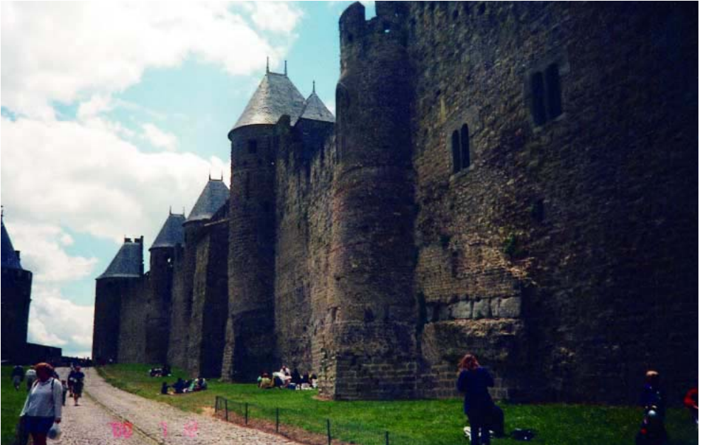
Middelalderbyen Carcassonne, som er den største og mest velbevarede borg i verdenen