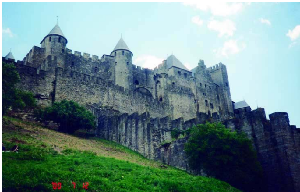
Middelalderbyen Carcassonne, som er den største og mest velbevarede borg i verdenen

Sidst på eftermiddagen fandt vi en lille campingplads, ikke mange km fra næste dags turist mål.